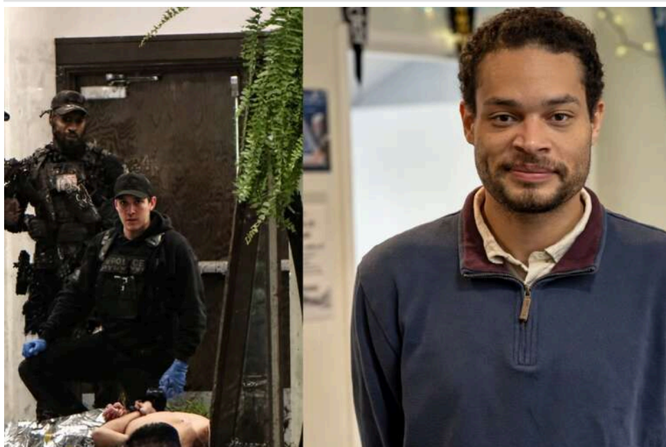
Замах на Трампа у Вашингтоні: розвідка США пов'язує дії нападника з війною проти Ірану

Американська розвідка дійшла попереднього висновку, що війна США та Ізраїлем з Іраном могла вплинути на мотиви Коула Аллена, якого обвинувачують у спробі замаху на президента США Дональда Трампа. Воно сталося під час вечері Асоціації кореспондентів Білого дому у Вашингтоні.