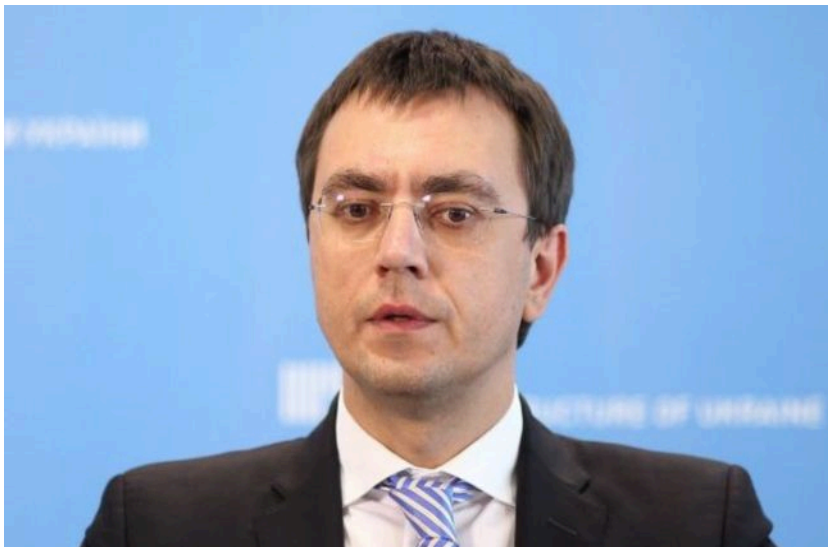
Фото: колишній міністр інфраструктури України Володимир Омелян (РБК-Україна)