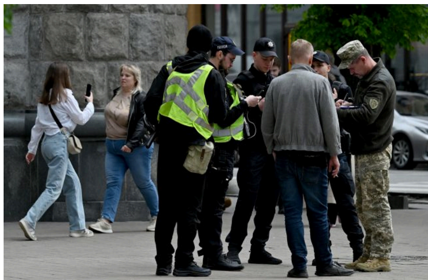
Фото: в Раді пропонують зробити відеофіксацію стає обов'язковою умовою для проведення мобілізації