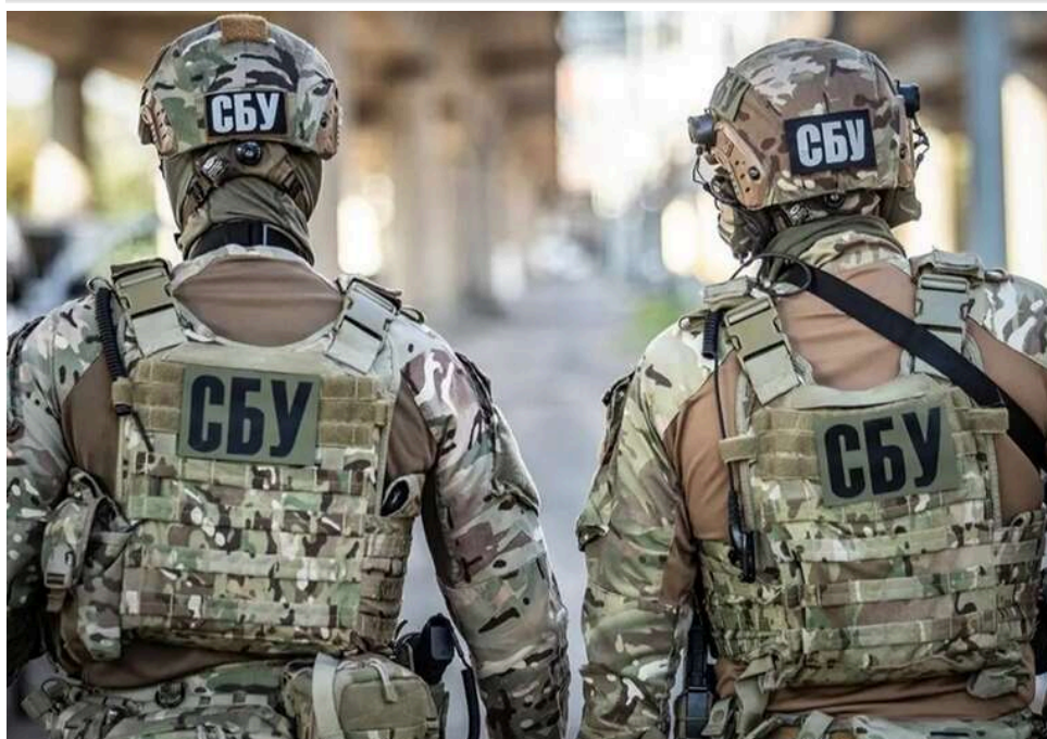
Обшуки СБУ в ТЦК Дніпра: ЗМІ пов'язують інцидент із затриманням депутата міськради

У Дніпрі працівники Служби безпеки України проводять обшуки в місцевому територіальному центрі комплектації, повідомляють ЗМІ. У медіа також повідомляють, що можливою причиною обшуків є те, що військові забрали до ТЦК депутата міської ради або його помічника.