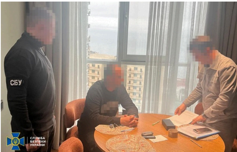
Затримано одного з учасників угруповання, який перебував в Україні

Слідчі дії велись спільно з Фінляндією. А до складу угруповання входили громадяни України та іноземці.