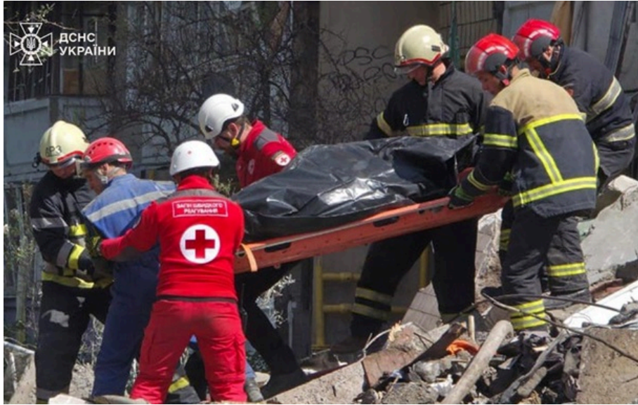
З-під завалів багатоповерхівки в Дарницькому районі дістали тіла ще двох жертв

Число постраждалих у столиці України зросло до 40 осіб. Більшість з них перебувають у лікарнях.