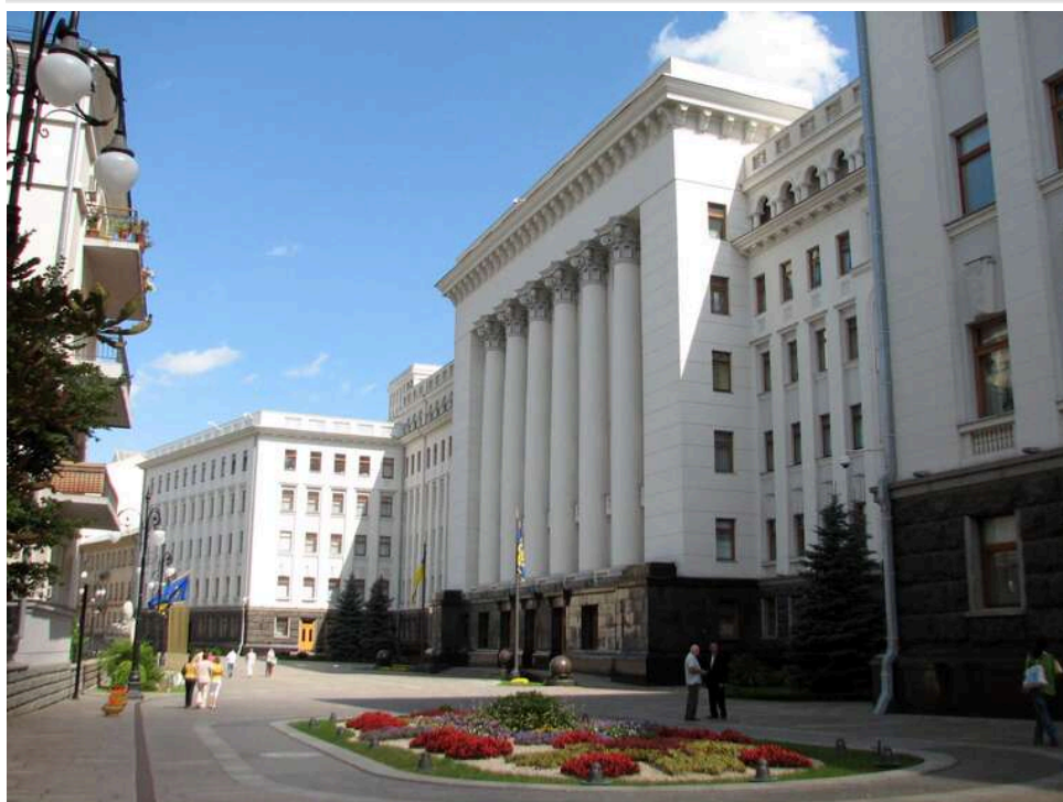
Свої серед ворогів: як кадри влади стали головною загрозою для її репутації

Останні тижні показали головну проблему влади – її руйнують не опозиція і не зовнішні вороги, а люди, яких вона сама привела до влади і роками захищала.