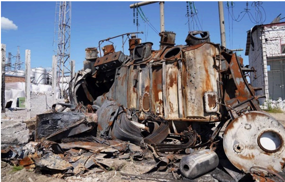
Наслідки російської атаки на енергооб'єкт (архівне фото)

Аварійно-відновлювальні роботи у кожному з регіонів почалися одразу після того, як це дозволила безпекова ситуація.