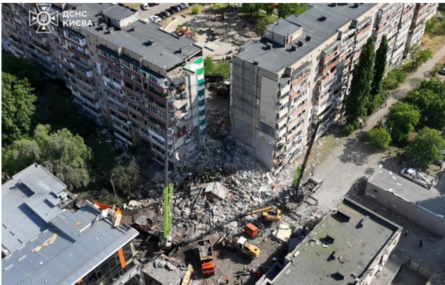
Наслідки атаки в Дарницькому районі 14 травня

Росіяни запустили на українську столицю весь спектр засобів, які в них є, повідомив Юрій Ігнат.