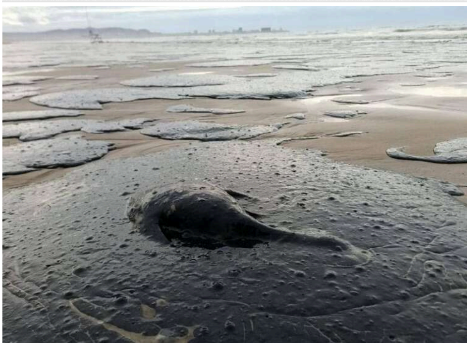
Екологічна катастрофа в Чорному морі: після удару по НПЗ у Туапсе утворилася масштабна нафтова пляма

Моніторингові сервіси та місцеві пабліки повідомляють про загрозу екологічного забруднення в акваторії Чорного моря після інциденту на нафтопереробному заводі в Туапсе.