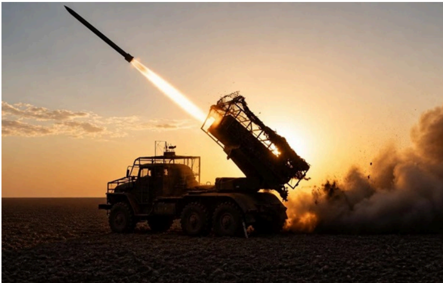
На Придніпровському напрямку українські підрозділи зупинили дві ворожі атаки в напрямку Антонівки