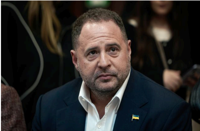
Фото: Андрій Єрмак (Getty Images)