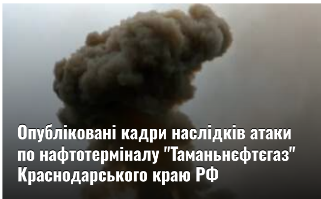
Опубліковані кадри наслідків атаки по нафтотерміналу "Таманьнефтегаз" Краснодарського краю РФ