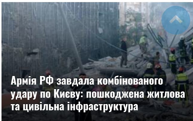
Армія РФ завдала комбінованого удару по Києву: пошкоджена житлова та цивільна інфраструктура