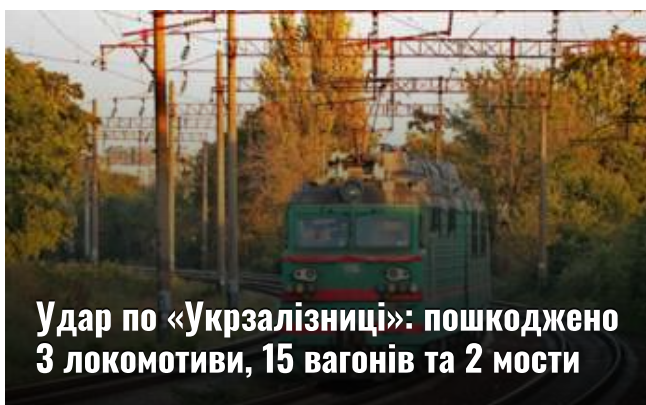
Удар по «Укрзалізниці»: пошкоджено 3 локомотиви, 15 вагонів та 2 мости