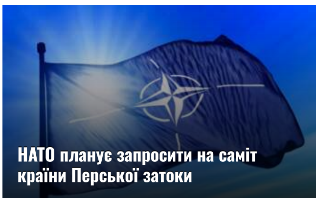
НАТО планує запросити на саміт країни Перської затоки