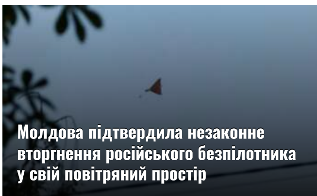
Молдова підтвердила незаконне вторгнення російського безпілотної у свій повітряний простір