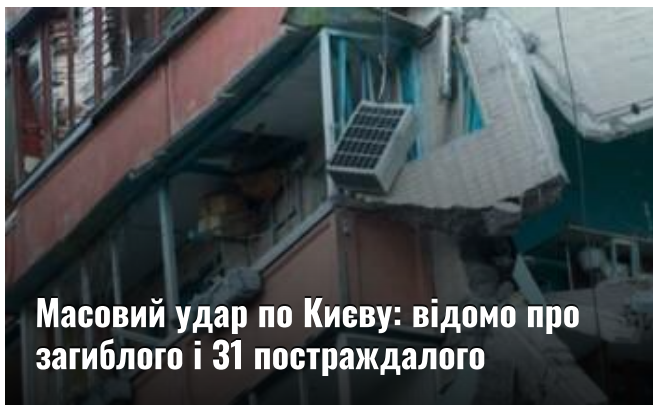
Масовий удар по Києву: відомо про загиблого і 31 постраждалого