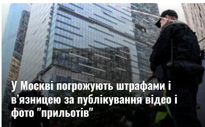
У Москві погрожують штрафами і в'язницею за публікування відео і фото "прильотів"