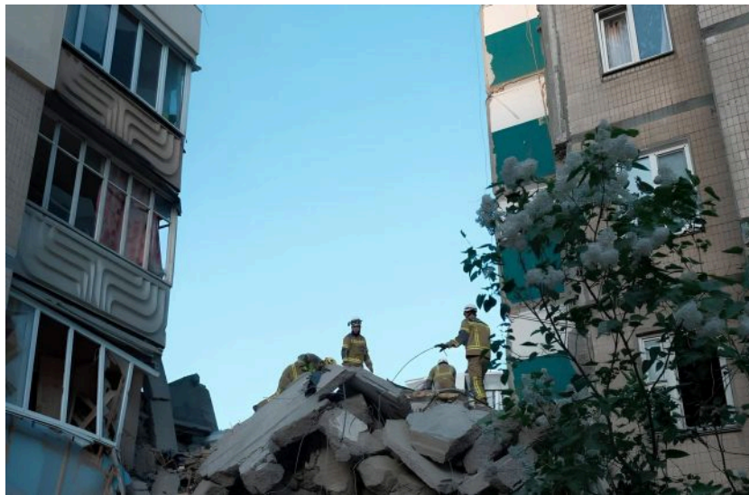
Фото: Кулеба розповів про наслідки удару по Києву та Україні (t.me/dsns_telegram)