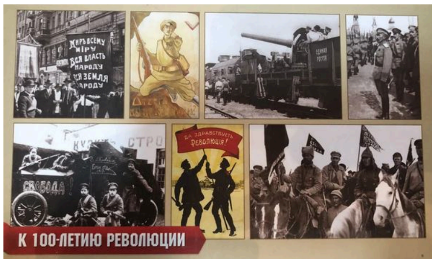
Один із російських плакатів до 100-ліття революції

Читайте також: Київська Русь чи Давня Русь: Шість тверджень які спростовують російську пропаганду