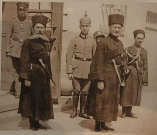
◀ Гетман П.П. Скоропадский в окружении своих соратников и немецких солдат. 1918 г.

Созданная в апреле 1918 г. Закавказская демократическая федеративная республика просуществовала недолго и распалась. Вместо нее образовались Грузинская, Азербайджанская и Армянская республики. Советская власть в Закавказье сохранялась только на территории Бакинской коммуны. Однако 31 июля