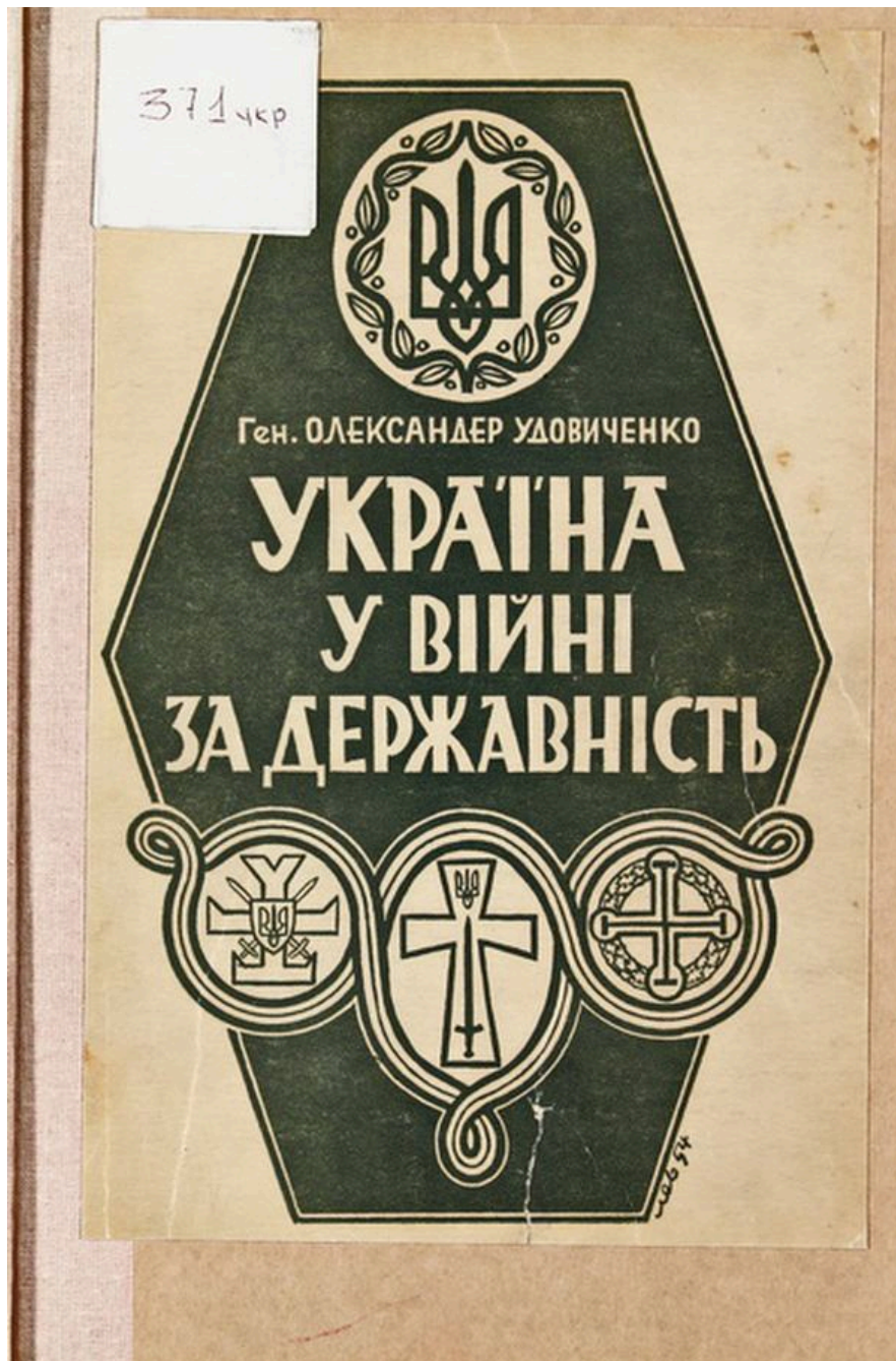
Книжка генерала Армії УНР Олександра Удовиченка «Україна у Війні за Державність»

Отже, напевно, настав час нарешті навести лад у нашій історичній науці та шкільних програмах і «назвати речі своїми іменами». А саме — забути про «Українську революцію, 1917–1921» та вживати правильну термінологію: «Війна за державність, 1917–1923».