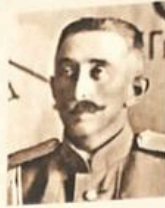
Денисов, Святослав В. Военачальник. Участник 1915 г. в чине полковника воевал против Новочеркасска. Позже стал управляющим Военной Воюющей Дивизии Донского. В 1918 г. переехал в США.

Белорусская Рада, провозгласившая в конце марта 1918 г. отделение Белорусской Народной Республики от России, тесно сотрудничала с германскими оккупационными властями. В августе 1918 г. правительство РСФСР признало право польского народа на самоопределение, что послужило основанием для создания независимой Польской Республики. Румыния, нарушив соглашение с РСФСР о выводе своих войск с территории Бессарабии, в апреле аннексировала ее.