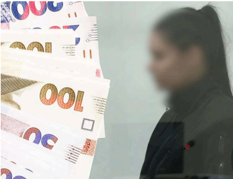
Справа патрульної з Прилук: поліцейській, яка на смерть збила дитину, висунули нову підозру - у вимаганні хабаря

Поліцейській, яка наїхала на дитину в Прилуках, пред'явили нову підозру – цього разу за хабар від ухлянтта.