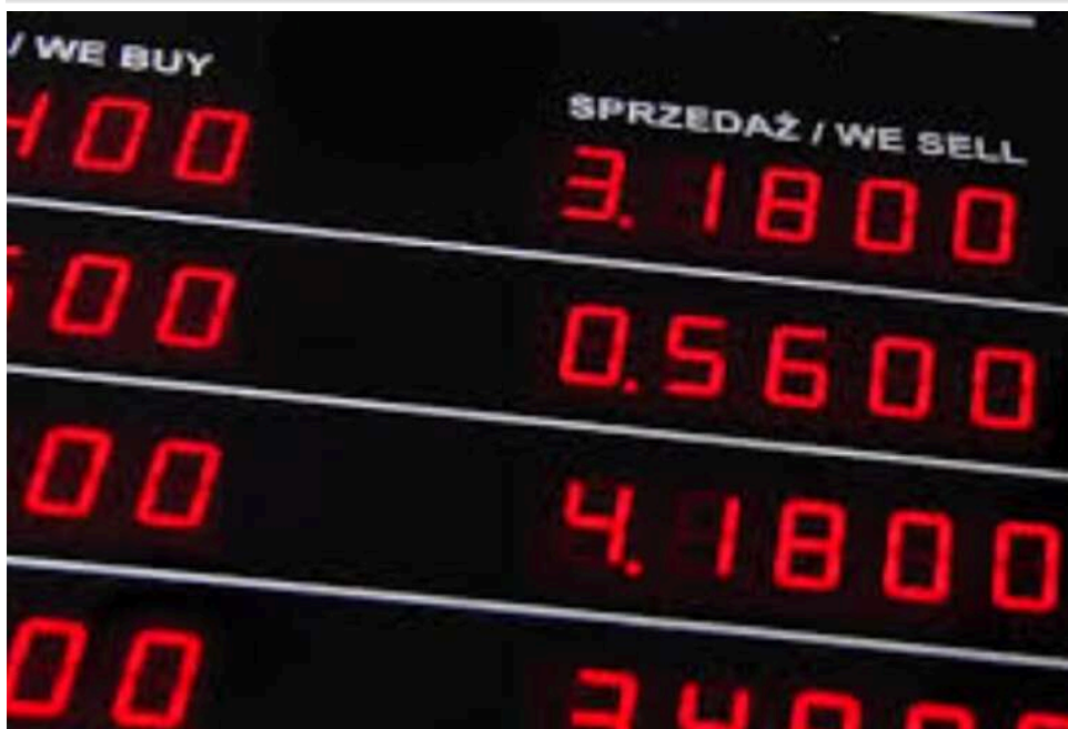
Пастка в обмінниках Кракова: як українців дурять через «вигідні» курси та незрозумілі позначення

Українців у Польщі можуть вводити в оману в обмінниках через маніпуляції з курсами та незрозумілі позначення валют, у результаті чого люди отримують значно менше грошей. Щоб не втратити кошти, потрібно уважно перевіряти курс саме для своєї валюти, уточнювати суму до обміну заздалегідь і уникати підозрілих пунктів із "занадто вигідними" пропозиціями.