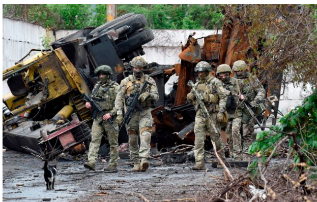
Фото: російські військові (Gettyimages)

Противник укотре спробував використати нестандартні шляхи та швидкісну техніку для проникнення в тил українських позицій, однак зіткнувся з підготовленою обороною.