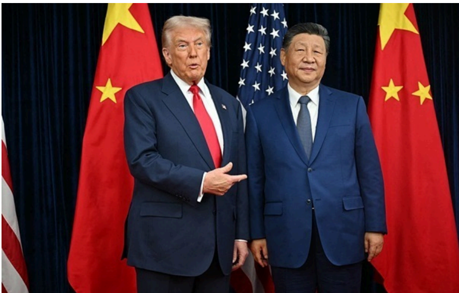
Дональд Трамп і Сі Цзіньпін

На двох лідерів чекає інтенсивний день, який включатиме двосторонню зустріч, культурний візит до Храму Неба та державний банкет.