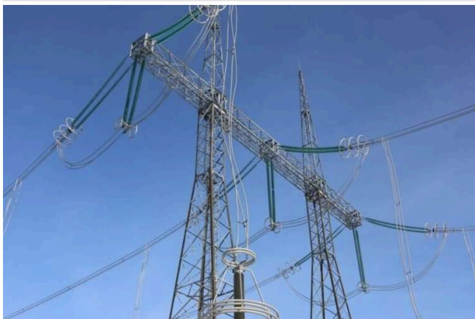
Молдова виставить Росії рахунок за ремонт пошкодженої лінії електропередачі "Ісакча – Вулканешти"

Молдова отримала рахунок на близько 500 тисяч леїв (20 тисяч євро) за ремонт лінії електропередачі "Ісакча – Вулканешти", і його відправлять РФ.