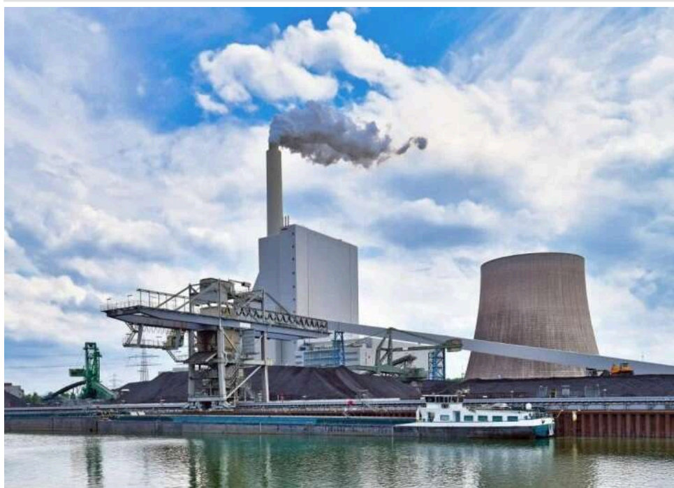
Енергетичний тил: Ізраїль допоможе Німеччині поставками газу та природного газу на запит Берліна

У відповідь на запит Берліна Ізраїль готовий допомогти Німеччині постачаннями газу та природного газу.