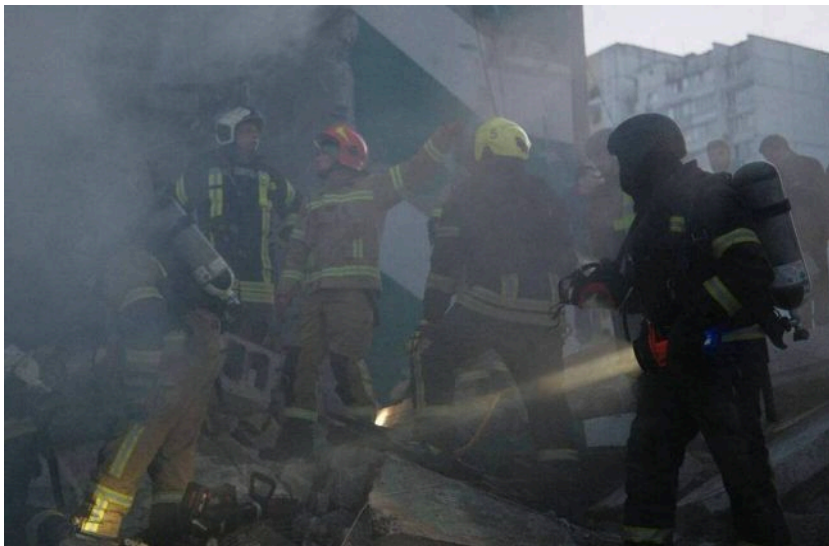
Фото: рятувальники на виклику