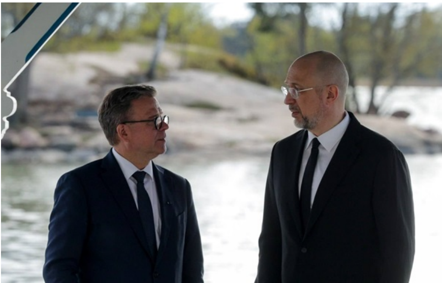
Шмигаль зустрівся з прем'єр-міністром Фінляндії

Фінляндія та Україна мають спільне розуміння того, що енергетика є питанням національної безпеки.