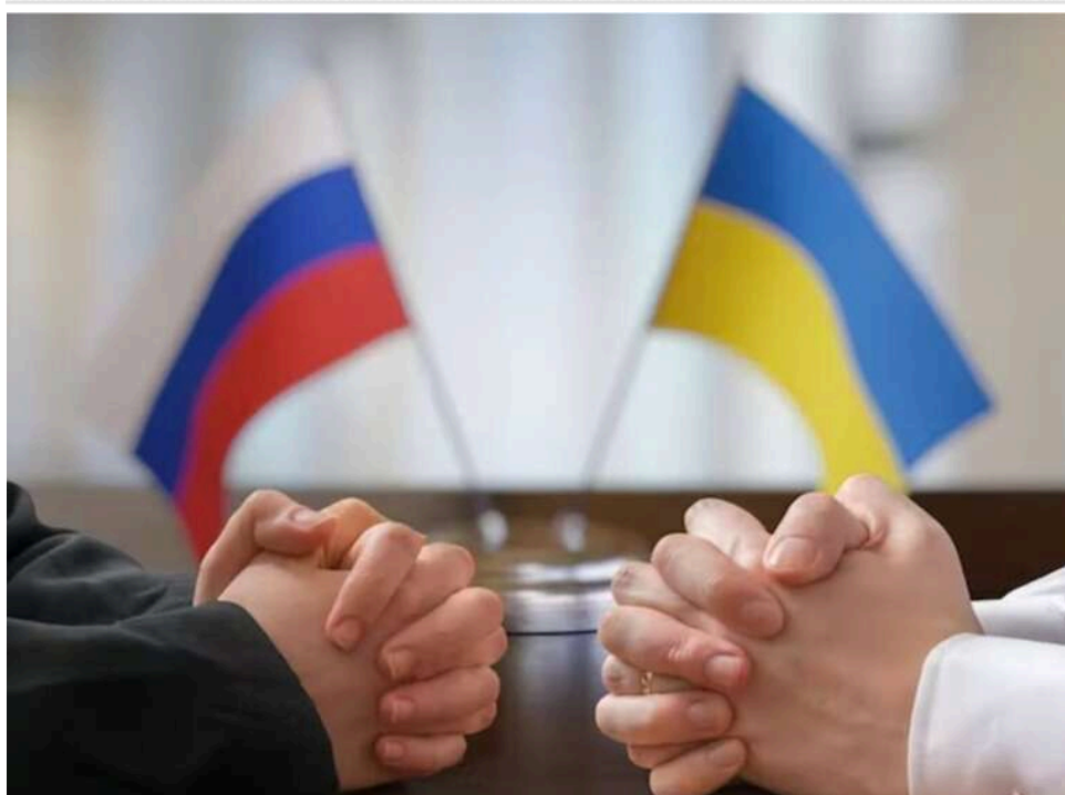
Переговори між Україною та РФ залишаються малоімовірними навіть за посередництва США

Ймовірність відновлення мирних переговорів між Росією та Україною за посередництва США залишається вкрай низькою навіть після можливого завершення конфлікту на Близькому Сході.