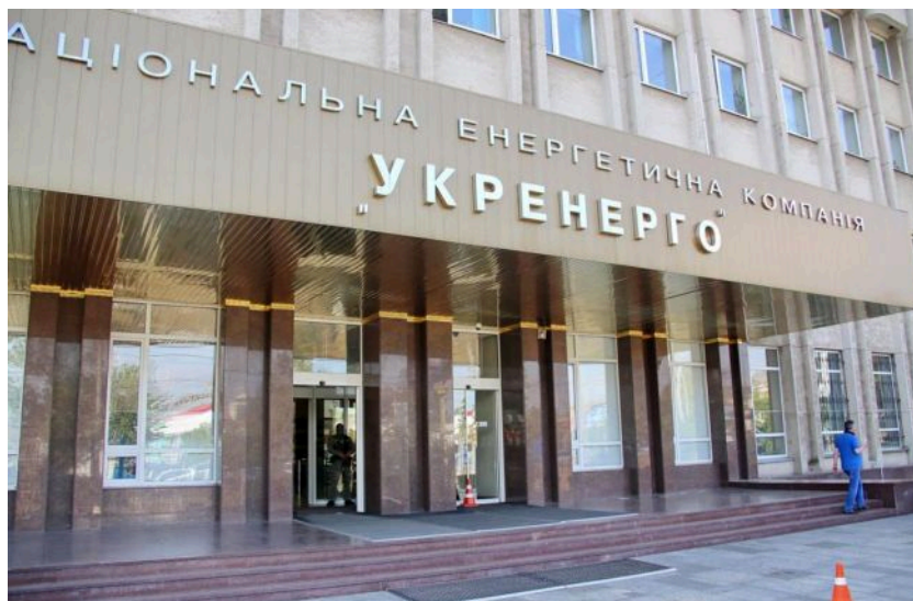
Кабмін оновив наглядові ради "Укренерго" та "Оператора ГТС"