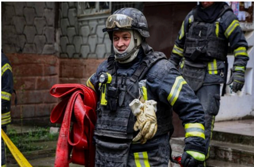
Фото: ворог від ранку масовано атакує Україну (t.me/dsns_telegram)