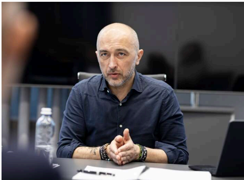
Ефект доміно: як кримінальна справа проти Єрмака може призвести до відставки голови НБУ Пишного

На тлі скандалу в Україні з кримінальною справою проти Єрмака у фінансових колах поширилися стійкі чутки про можливу швидку зміну керівника Нацбанку.