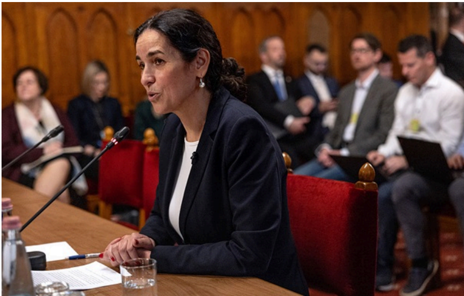
Аніта Орбан зробила заяву щодо обстрілу України

Уряд країни постійно стежить за подіями та внесе питання до порядку денного сьогоднішнього засідання.