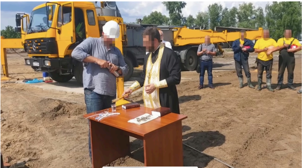
Фото з освячення будівництва «Династії»

Читайте по темі: У Києві експравоохоронець продавав «бронь» від армії за 9000 доларів у крипті: справу передано до суду