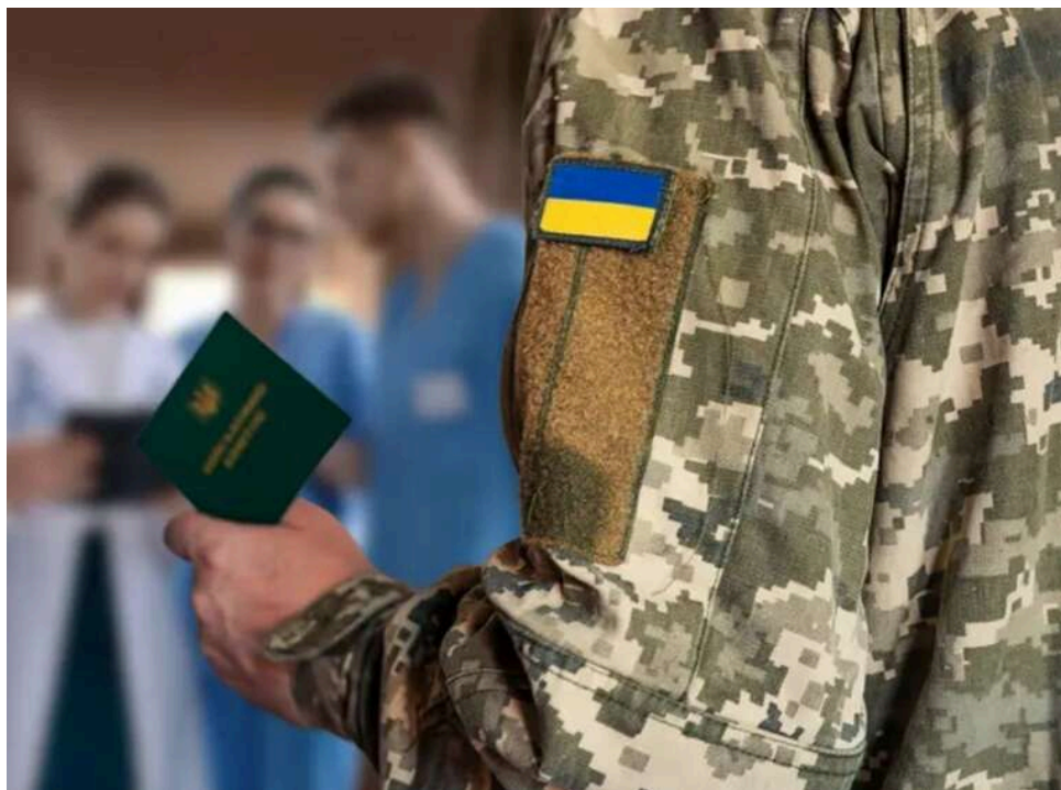
Апеляційний суд підтвердив право ЦВЛК скасовувати висновки про непридатність до служби

Другий апеляційний адміністративний суд розглянув справу щодо перегляду висновку військово-лікарської комісії про непридатність до військової служби. Спір виник після того, як чоловік, якого у 2022 році визнали непридатним та виключили з військового обліку, через два роки побачив у застосунку «Резерв+» зміну статусу на «військовозобов'язаний». Як з'ясувалося, Центральна військово-лікарська комісія скасувала попередній висновок ВЛК, вважаючи його таким, що не відповідав вимогам Розкладу хвороб.