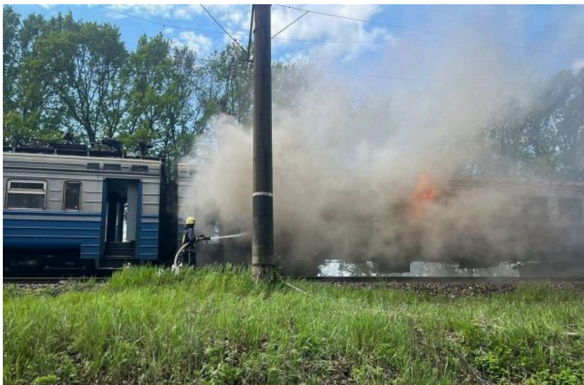
Фото: російський удар по потягу (t.me/dsns_telegram)