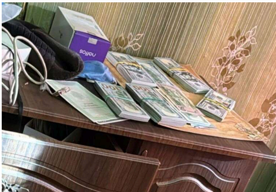
Віддали 3 мільйони гривень «на перевірку СБУ»: у Києві викрили масштабну схему обману пенсіонерок

У Києві дві пенсіонерки стали жертвами шахраїв, які видавали себе за співробітників Служби безпеки, віддавши 3 млн грн.