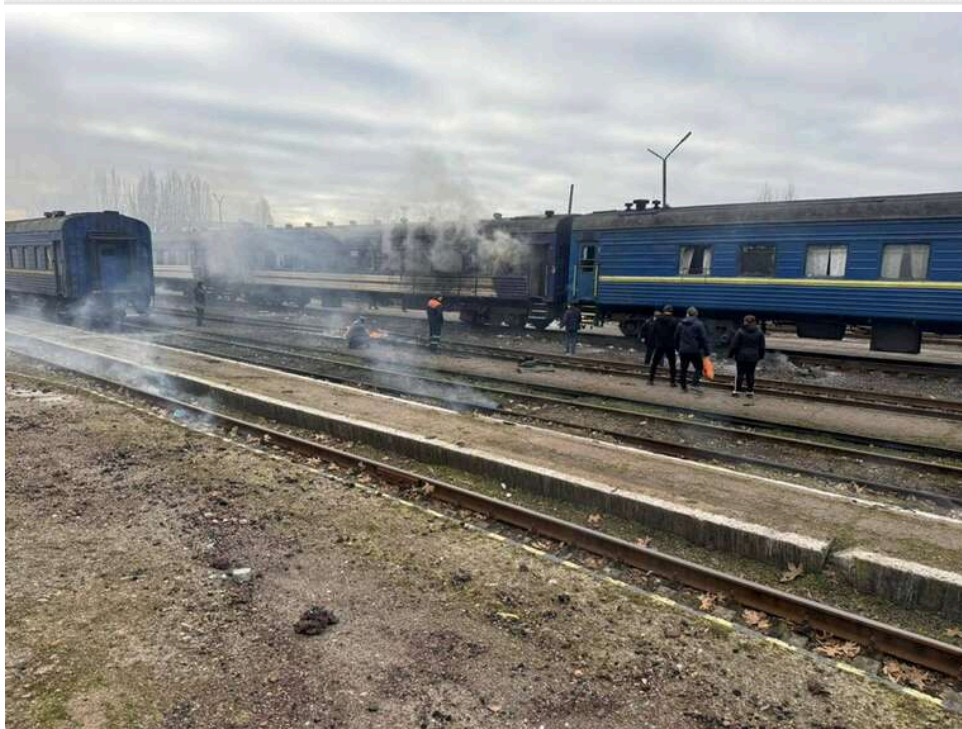
За добу Росія завдала 23 ударів по об'єктах української залізниці, – Литвин

З початку доби 13 травня російська окупаційна армія неодноразово атакувала українську залізничну інфраструктуру. Зафіксовано 23 влучання в об'єкти.