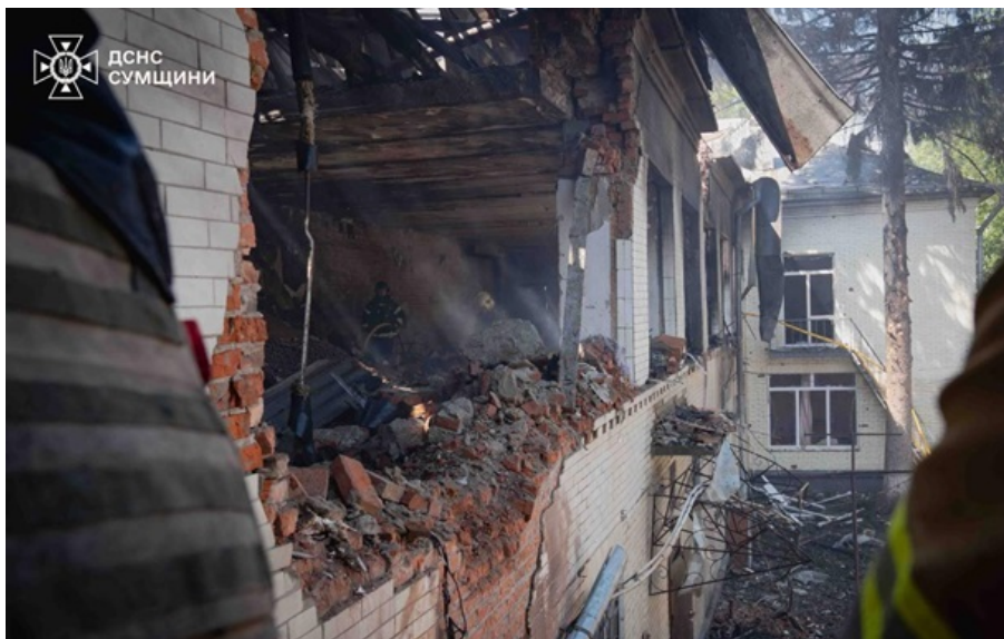
Рятувальники знайшли двох загиблих жінок у зруйнованому дитсадку в Сумах

Під час ранкової атаки н Суми фіксували близько 10 російських дронів. Частина з них вдалося знищити.