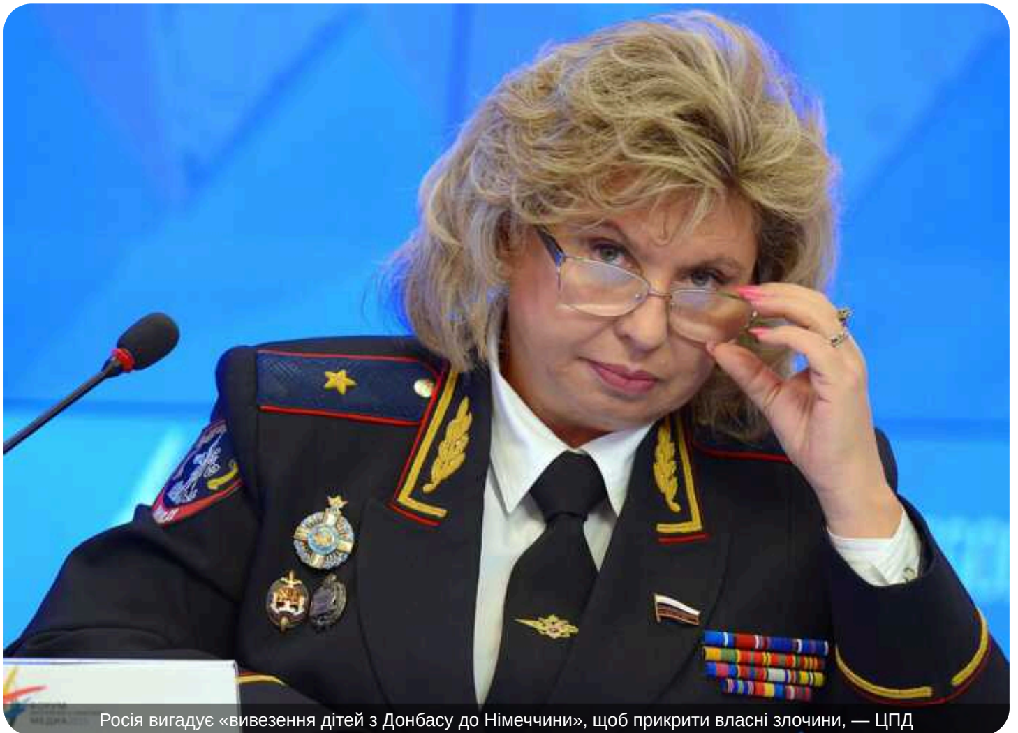
Росія вигадує «вивезення дітей з Донбасу до Німеччини», щоб прикрити власні злочини, — ЦПД

Російська омбудсменка Тетяна Москалькова під час зустрічі з російським диктатором Владіміром Путіним озвучила черговий пропагандистський