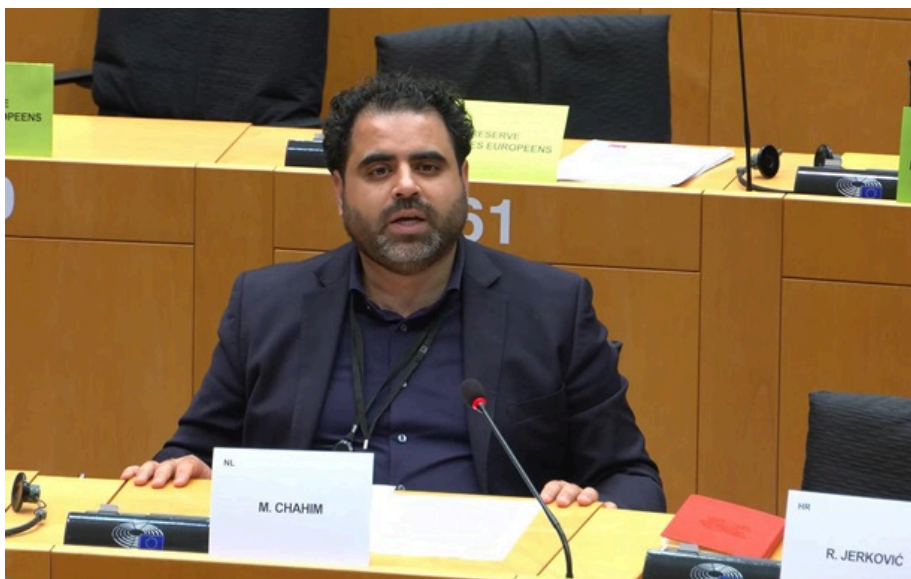
Мохаммед Шагім вважає, що нинішній механізм форс-мажору не враховує реалії війни в Україні