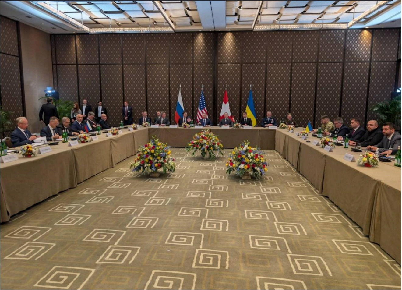
Росія все ще намагається виключити Україну з переговорів

Путіну потрібна угода про "архітектуру безпеки" з Трампом, а не із Зеленським. А після того, як президент України дозволив своїм указом парад у Москві, чим принизив Володимира Путіна особисто, росіяни взялись запускати чергову інформаційну хвилю – розганяти "старі платівки" про "наркоманію" і "диктатуру в Україні".