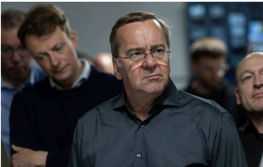
Борис Пісторіус перебуває з візитом в Україні

Військовики показали ситуацію на фронті, як працюють із системою DELTA, планують штурмові операції, знищують логістику ворога, ведуть розвідку та координують різні типи дронів у єдиній системі управління боєм.