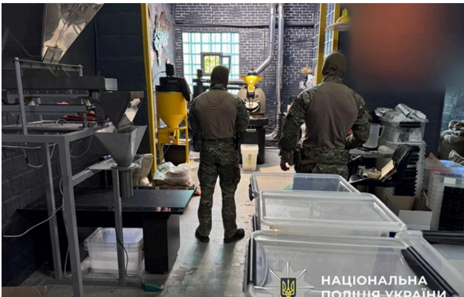
Кіберполіція та БЕБ викрили групу осіб, які налагодили масштабне виробництво та продаж фальсифікованої кави

Фальсифіковану продукцію, яка не проходила жодного контролю якості чи сертифікації, збували через кав'ярні, а також відомі маркетплейси та власні онлайн-ресурси