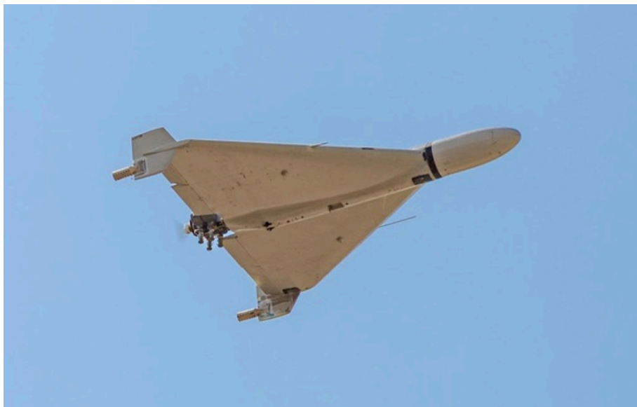
Сотні "шахедів" вдень атакують Україну

Росіяни запускають дрони вздовж кордону з Білоруссю на відстані 5-10 кілометрів. Тактика спрямована на перевантаження української ППО для прориву на захід.