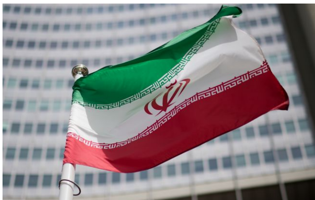
Фото: прапор Ірану (Getty Images)

Іран заявив про відсутність наміру відновлювати переговори зі США і підтвердив закриття Ормузької протоки, що ще більше загострює ситуацію на Близькому Сході.