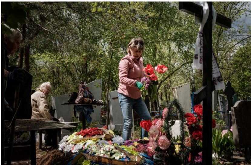
Від штучних квітів на кладовищі час відмовитись

Напередодні поминальних днів питання штучних квітів на кладовищах як ніколи актуальне. Поки в одних населених пунктах від пластику вже відмовляються, в інших - досі "триває боротьба".