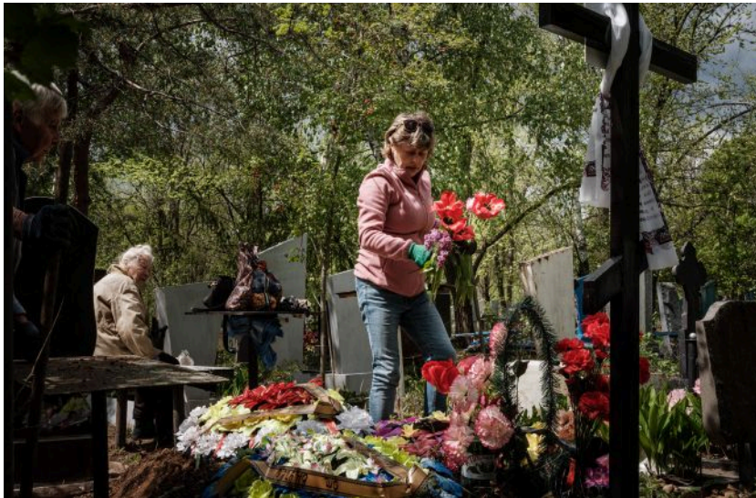
Від штучних квітів на кладовищі час відмовитись