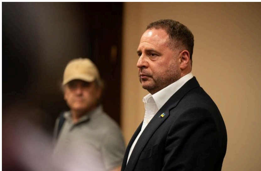
колишній керівник ОП Андрій Єрмак