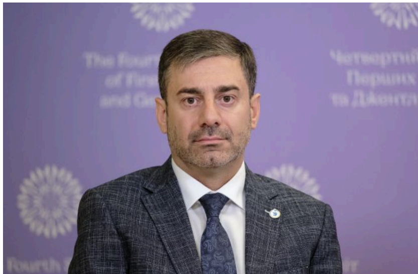
Фото: Дмитро Лубінець