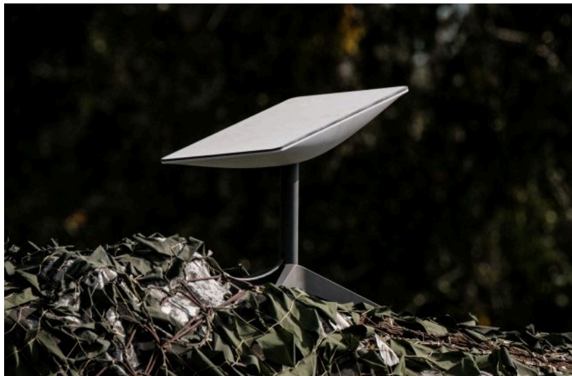
Фото: СБУ затримала агента РФ, який реєстрував Starlink для окупантів