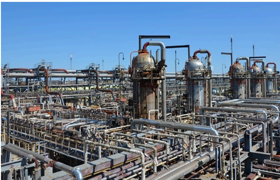
Фото: Астраханський ГПЗ Горіння буде усунуто протягом кількох годин, запевняє місцева влада

Голова Астраханської області традиційно заявив про "уламки" нібито збитих дронів, що "викликали спалах".