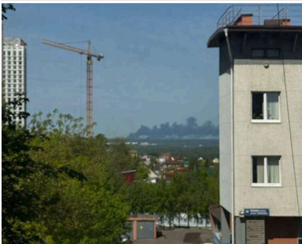
Технологічний збій замість атаки: під Уфою спалахнула нафтобаза «Транснефті»

У селі Нурліно під Уфою (Росія) горить нафтобаза, повідомляють російські пабліки.