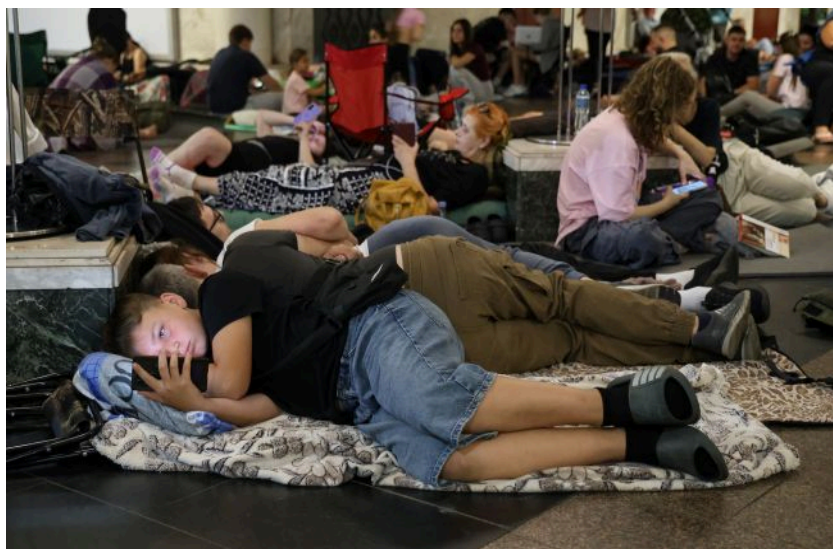
Фото: Повітряні сили закликають не ігнорувати повітряну тривогу (Getty Images)