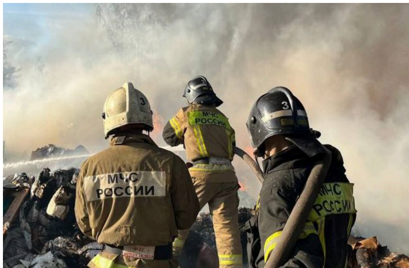
Фото ілюстративне: у російському Башкортостані спалахнув один із найбільших вузлів "Транснефті" (росЗМІ)